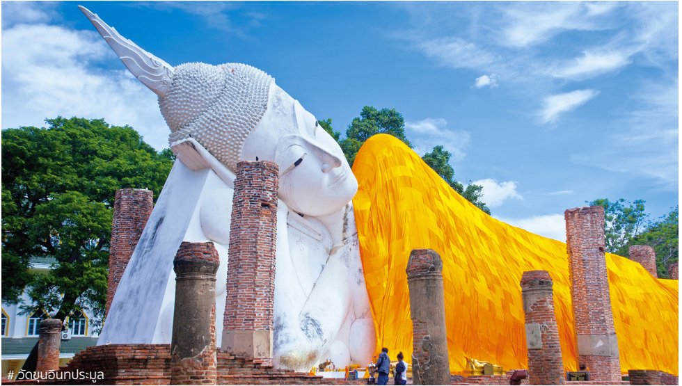
# วัดขุนอินทประมูล