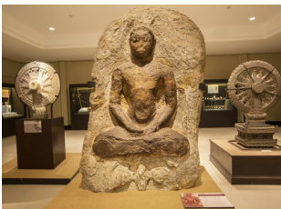
# พิพิธภัณฑ์อุทอง