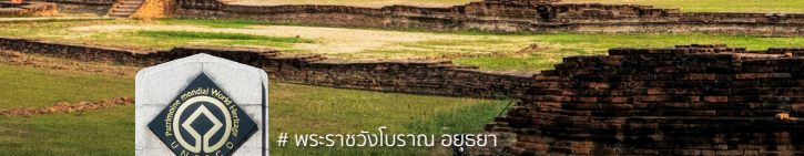
# พระราชวังโบราณ ออยุธยา