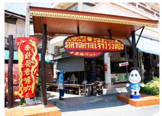
# ตลาดวิเศษชัยชาญ

เริ่มจากสุพรรณบุรีจุดหมายที่มีสถานที่ท่องเที่ยวหลายรูปแบบ ไม่ว่าจะเป็นวัดเก่าแก่ที่สวยงาม เช่น วัดเขาท่าเหิม วัดหนองพุทรากรู เป็นต้น ฟังเรื่องราวของดินแดนสุวรรณภูมิ “เมืองโบราณอุทอง อรุณรุ่งแห่งอารยธรรมไทย” แวะชมเรื่องราวของชาวจีนที่อพยพมาอยู่ในไทย นอกจากประวัติศาสตร์ ยังมีกิจกรรมทำศิลปะบนฟายาดม ทำและทานขนมหวานที่ทำจากหัวผักกาดนึ่งเพื่อสุขภาพดี น้ำทำจีน ตื่นเข้ามาสร้างสุขภาพที่ดีไปกับ “กิจกรรมสวนเท้าเปล่า” ออกกำลังกายด้วยเทคนิค “กดจุดสะท้อนเท้า” พร้อมใส่บาตรให้ใจฟู