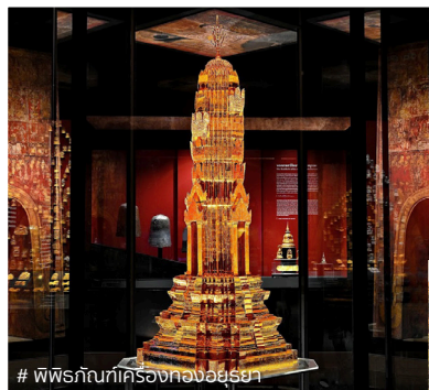
# พิพิธภัณฑ์เครื่องทองอยุธยา