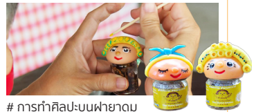
# การทำศิลปะบนฟายาดม