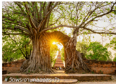
# วัดพระงามคลองสระบัว

ในวาระที่กรุงศรีอยุธยาใกล้ วาระครบรอบ 33 ปี ที่ UNESCO ได้ขึ้นทะเบียนอยุธยาเป็นเมือง มรดกโลก KTC ขอเชิญทุกท่าน มาค้นหาคำตอบนอกกรอบตำรา กับเรื่องราวของกรุงศรีอยุธยา ในมุมมองใหม่ เช่น “วัดกุฎีตา” โบราณสถานตำนานปู่โสมเฝ้าทรัพย์ พบกับย่านการค้าเมืองเซลิเซ่แห่ง อยุธยา “วัดบรมพุทธาราม” บ้านเดิม ของพระเพทราชา พาชมนิทรรศการ เครื่องทองที่ดีที่สุดในประเทศ ฟัง เรื่องราวอากาศรรพจักการลึกลับ ชุดโบราณวัตถุ ทำลายโบราณสถาน