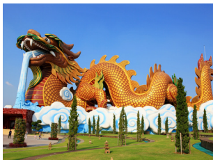
# พิพิธภัณฑ์ลูกหลานพันธุ์มังกร