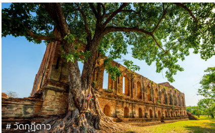
# วัดกุฎีตา