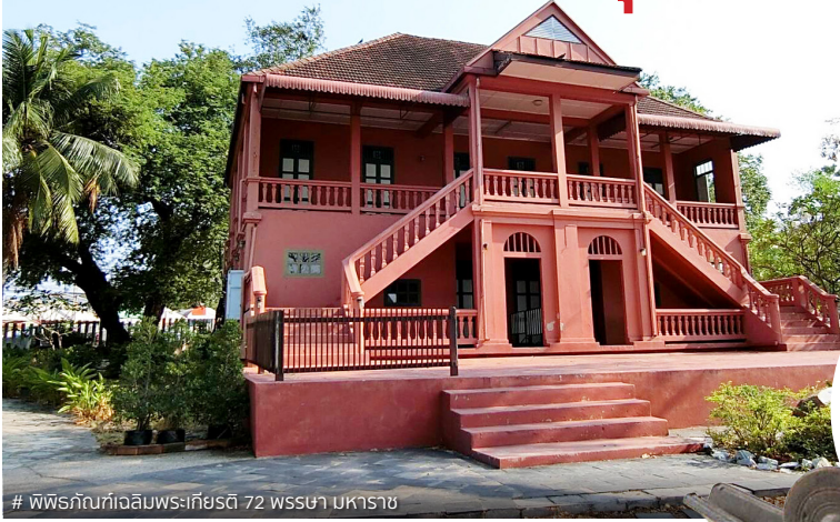
# พิพิธภัณฑ์เฉลิมพระเกียรติ 72 พรรษา มหาราช