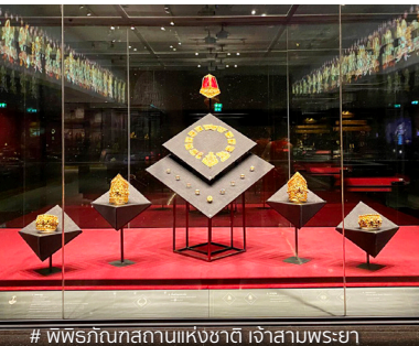
# พิพิธภัณฑ์สถานแห่งชาติ เจ้าสามพระยา

สำหรับท่านที่ชอบความงามล้ำค่าและของโบราณ พลัดไม่ได้กับทรัพย์สินพิเศษ KTC พาทุกท่านไปชม พิพิธภัณฑ์ศิลปแผ่นดิน สถานที่รวบรวมผลงานของช่างสถาปนาศรีภคที่สมเด็จพระนางเจ้าสิริกิติ์ พระบรมราชินีนาถ พระบรมราชชนนีพันปีหลวง ทรงตั้งพระราชหฤทัยให้มีพิพิธภัณฑ์เก็บรวบรวมผลงานตั้งแต่เริ่มทำจนถึงผลงานประณีตศิลป์ชิ้นเอก (Master Piece) ด้วยสองมือลูกหลานชาวนา ชาวไร่ ผู้ยากจน ไม่มีแบบ ไม่มีพิมพ์ ไม่มีหุ่นงานบางชิ้นใช้เทคนิคที่มีรากฐานจากศิลปะไทยโบราณตั้งแต่สมัยอยุธยา จากนั้นพาทุกท่านไปชม นิทรรศการเครื่องทองอยุธยา อาคารเครื่องทองที่ใหญ่ที่สุดในไทย ณ พิพิธภัณฑ์สถานแห่งชาติ เจ้าสามพระยา สร้างขึ้นในสมัยรัชกาลที่ 9 ชวนชมความงามล้ำค่า