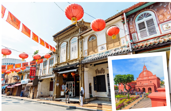
# ยองเกอร์สตรีท

ชมช่องแคบที่ยาวที่สุดในโลก และล่องเรือชมความงาม ของอาคารโบราณ สถาปัตยกรรมแบบจีน-โปรตุเกส ของสองฝั่งแม่น้ำมะละกา เที่ยวคุกหาสน์เปอร์รานากัน “บาบ๋า-ย่าหยา” วัฒนธรรมผสมผสานที่มีเอกลักษณ์ ไม่เหมือนใคร ชมย่านอาหารการกินที่ยองเกอร์สตรีท