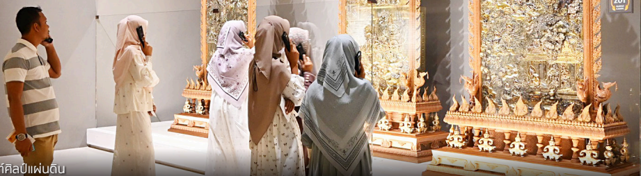
# พิพิธภัณฑ์ศิลปแผ่นดิน