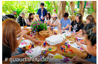
# ชุมชนตะเคียนเตี้ย

ราคา : 1,700 บาท/ท่าน สำรองที่นั่ง : 16 - 18 ธันวาคม 2567 จำกัด : 12 ท่าน (ขั้นต่ำ 10 ท่าน) กิจกรรม : เสาร์ที่ 25 มกราคม 2568 สถานที่นัดหมาย : อาคาร UBC2 (ซอย สุขุมวิท 33)