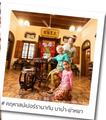
# คุกหาสน์เปอร์รานากัน บาบ๋า-ย่าหยา